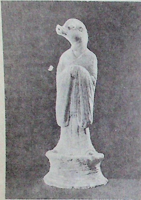
Статуэтка, изображающая Свинью Из раскопок могильника времен династии Тан (714 г. н.э.) в городе Сиань

Какими же качествами наделялись мужчины, родившиеся в год кабана? Согласно китайскому гороскопу, они отличаются храбростью, способностью к самопожертвованию. В начатое дело вкладывают все свои силы. Это очень мужественные и честные люди, и хотя трудно сходятся с другими, но своим многочисленным друзьям верны до конца жизни. Они немногословны, не признают отступлений, любознательны, не любят ссор и пререканий, добры, внимательны к тем, кого любят.