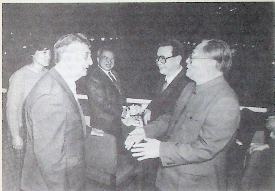
Архипов И.В., Цзян Цзэминь и Ли Пэн на трибуне Тянаньмыня. 1 октября 1989 г.

Ли Пэн. Каждый из них на хорошем русском языке пожелал Ивану Васильевичу здоровья и успехов. Он был глубоко тронут таким вниманием.