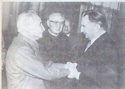
Архипов И.В., Чэнь Юнь и Бо Ибо. Декабрь 1984 г.

На четвертый день предстояла встреча Ивана Васильевича со своими старыми друзьями.