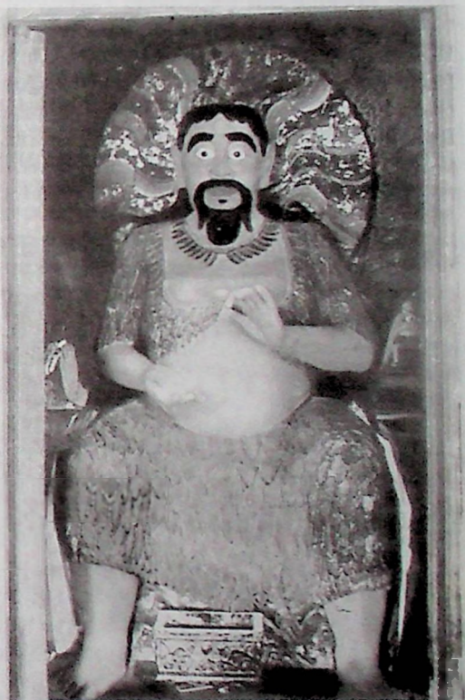
Статуя Фуси в храме Фуси в Лояне

Согласно “Шицзи” (63-я и 47-я главы), Лао-цзы тепло принял Конфуция. Он сказал ему следующее: “Я слышал, что преуспевшие в торговле купцы прячут свои богатства, чтобы никто не знал о них, люди нравственного поведения ведут себя внешне скромно, чтобы не выделяться. Ты должен отбросить зазнайство и путаницу в мыслях, не следует предаваться ненужным размышлениям, ты должен отказаться от снисходительной манеры и греховных помыслов. Они не принесут тебе пользы”. Из встречи с Лао-цзы Конфуций вынес