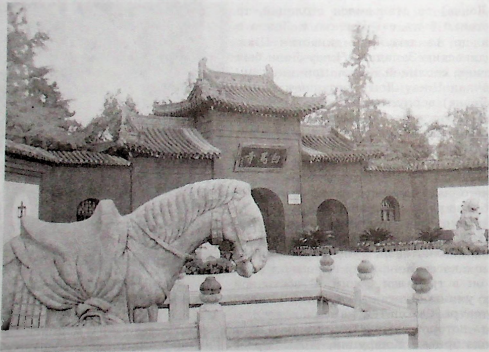
Храм Белой лошади в Лояне

За свою историю Лоян не раз переживал времена расцвета и упадка. При династии Восточная Хань он был культурным центром Китая, началом Великого шелкового пути, в государственном университете ( тайсюэ ) обучалось свыше 30 тысяч студентов, в городе была самая крупная в Китае библиотека Дунгуань, знаменитая обсерватория Линтай. Тогда здесь жили известный астроном Чжан Хэн, открывший армиллярную сферу и теллурий, знаменитый историк Бань Гу, написавши “Ханьшу” (“История Хань”) и др.