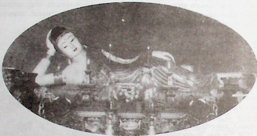
Спящий Нефритовый Будда

после пожара только в 1994 г. Ее высота — 34 м, внутри нее находится колокол весом в 6,5 тонн и статуя Будды высотой в 7 метров и весом в 5 тонн. Этот Будда олицетворяет собой большие надежды, ожидания людей. И колокол, и статуя были отлиты при императоре Минской династии Хунчжи. Башня с барабаном была построена при династии Юань и восстановлена в 1996 г. Ее высота также 34 метра, в ней находится самый большой в Китае барабан. (Башни Чжунлоу и Гулоу существовали в прошлом во многих городах Китая, в некоторых они есть и сейчас, например, в Сиане есть и Чжунлоу и Гулоу, в Пекине только Гулоу).