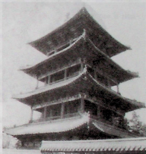
Башня с колоколом

Позади этой Залы друг против друга находятся Башня с колоколом (Чжунлоу) и Башня с барабаном (Гулоу). Первая башня была восстановлена