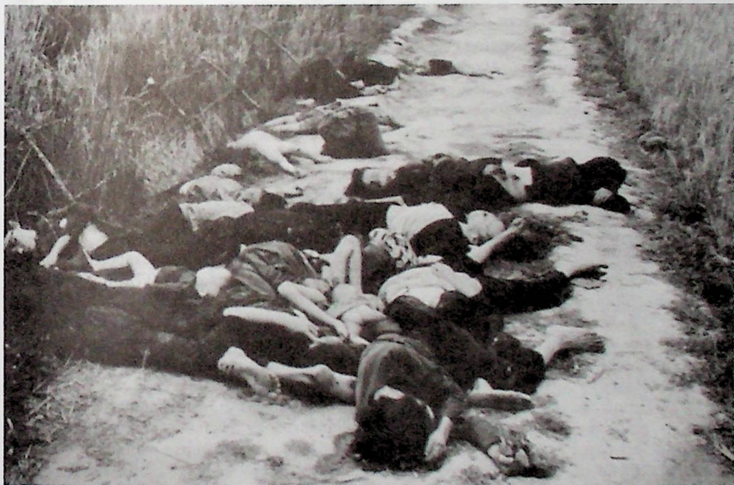
Несмываемые следы резни в Милай 16 марта 1968 г.

К лету 1967 г. стало очевидно, что война там затягивается, а масштабы интервенции США растут. Вооруженные силы США, численность которых со времени высадки в Дананге в марте 1965 г. достигла к концу 1967 г. 465 тыс. человек, не смогли предотвратить «инфильтрацию» все новых подразделений противника с легендарной «тропы Хо Ши Мина». Операции против базовых освобожденных районов оказались безрезультатными и не смогли изменить общее положение в стране. Быстро росли потери личного состава американцев. К концу 1967 г. США потеряли убитыми 16 250 человек, причем только в 1967 г. 9400 человек. Это вдвое превышало потери предшествующего 1966 г. Тем не менее командующий войсками генерал Уэстморленд и командующий Тихоокеанским флотом США адмирал Шарп докладывали в Вашингтон, что война идет успешно и они уже «видят свет в конце туннеля». Тем временем в бюджете страны образовалась «дыра» в 30 млрд долл. Оказалось, что даже такая экономика, как американская, не способна обеспечить стране одновременно «пушки и масло». Надо было выбирать.