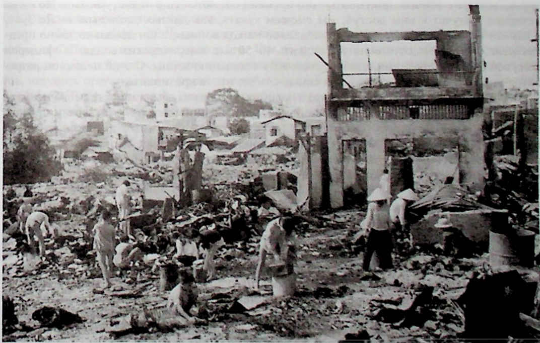
Жители сайгонского района Тёлон среди развалин после наступления и ответного огня сайгонских войск

Однако всеобщего восстания населения Южного Вьетнама, на которое, как считают многие авторы, рассчитывали Ле Зуан и его окружение, не произошло. В военном отношении добиться начального успеха не удалось нигде, кроме Хуэ, который удерживали 25 дней, но в 40 других атакованных городах и 70 поселках удавалось продержаться от 3 до 10 дней. После первоначальной паники американцам удалось организовать контрнаступление, и главные силы НВСО были вынуждены отступить, понеся значительные потери. Восстановить силы удалось только к 1972 году.